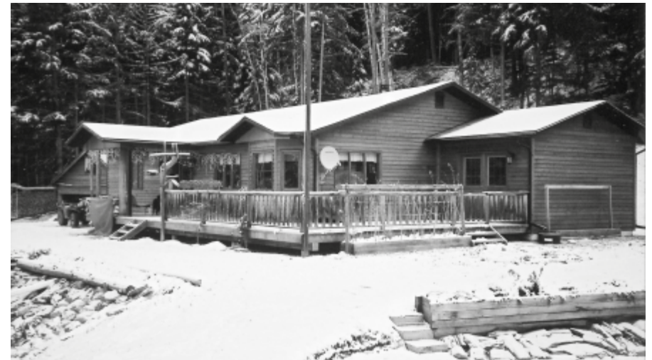
Weihnachten 1997 war das Haus bezugsbereit

Gisela und ich all die guten Sachen: am Holzhauerfest, am Herbstmarkt, am Weihnachtsmarkt und auf einmal kamen die Leute zu uns, weil es ihnen schmeckte!