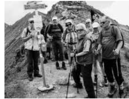
St. Antönier Joch

Heute Morgen klang es wie Musik in den Ohren. Unser Buschauffeur ruft nach den 38 «Teenagern». Die Fahrt über die Silvrettahochebene bis zum Kopssee ist ein besonderes Ereignis. Eine gemeinsame Wanderung vom Kopssee – zur Verbella Alpe – weiter durch das Europa-Schutzgebiet – zum Wiegensee – einfach Natur pur. Oft