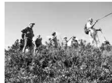
Sicht auf Hochjoch

Ein Bergfrühstück unter blauem Himmel im Silbertal mit Aussicht auf das Alpenpanorama war der Beginn eines eindrucksvollen Tages.