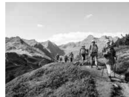
Grat Nova Stoba

Am Nachmittag benutzten alle die Gelegenheit, mit der langen Grasjoch- und Hochalpinbahn zur Hochalpila zu gondeln – 2443 m – eine unbeschreibliche Aussicht. Für einige gings zu Fuss runter zur Wormserhütte, später mit den Bahnen zurück in die Zivilisation.