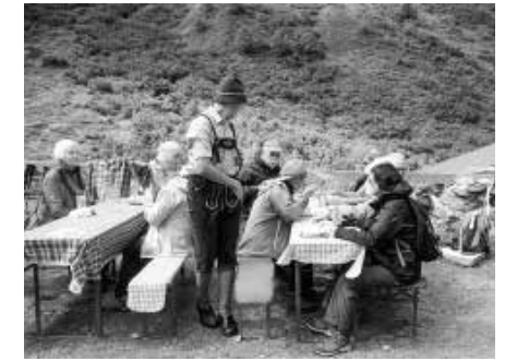
Rast Vergalda Alpe