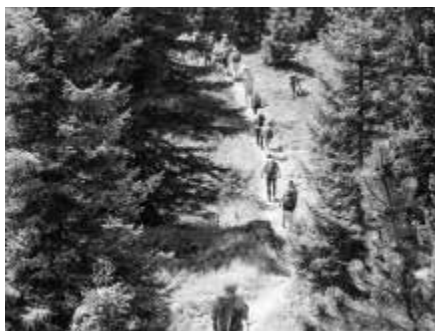
Karawane bei Wiegensee

glaubte man eine Karawane zu sehen, aber nein, das waren die fitten Berggänger von Senior mach mit!